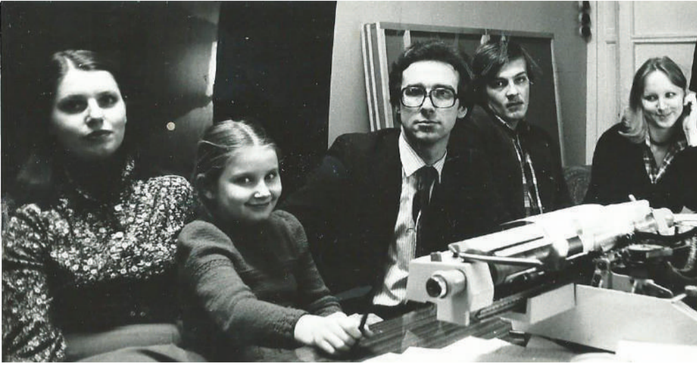
Начало на 1-й странице

Накануне юбилейной даты с особым уважением мы вспоминаем людей, в разные годы работавших в «бончевской» газете.