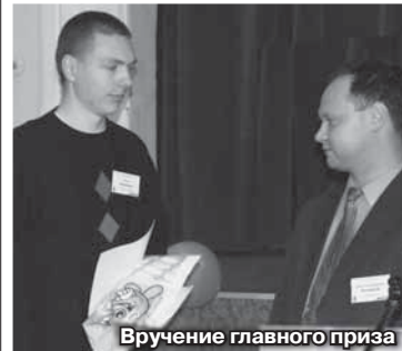
Вручение главного приза

Как студенту разжиться деньгами? Научиться программировать! На прошлой неделе пятеро студентов "Бонча" получили денежные премии на сумму более 2500 у.е. по итогам конкурса на разработку Java-игр для мобильных телефонов.