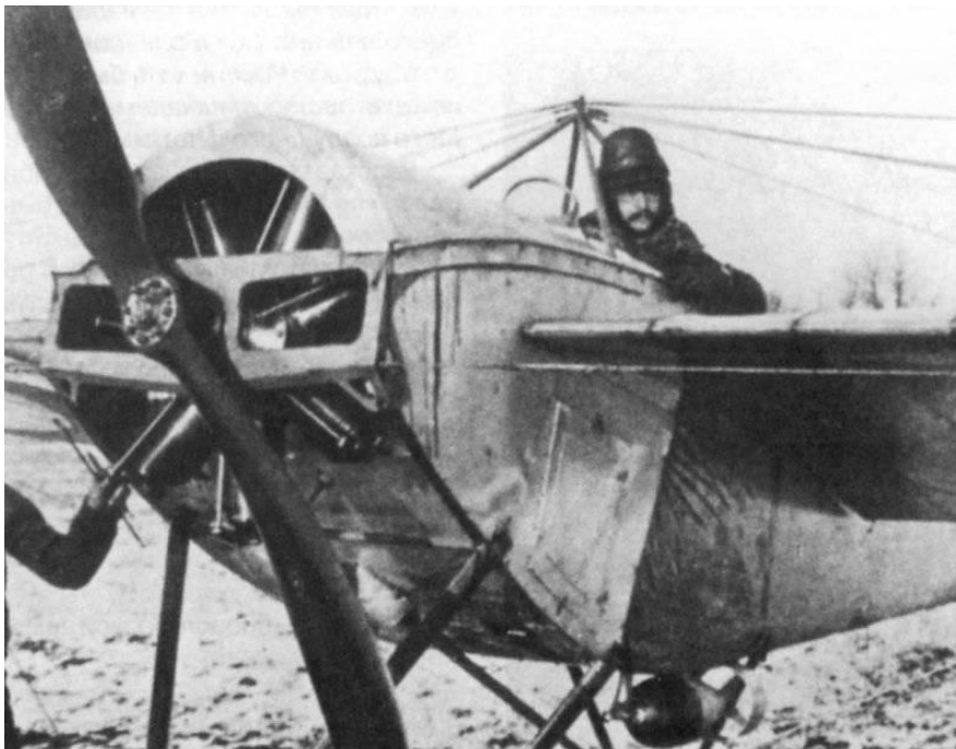
Рис. 6. Подполковник В.М.Ткачёв в кабине «Ньюпора» IV с подвешенной под фюзеляжем осколочно-фугасной авиабомбой, 1916 г.

скую боевую авиагруппу (сокращённо — 1-ю БАГ), состоящую из трёх истребительных авиаотрядов (рис. 6) [5].