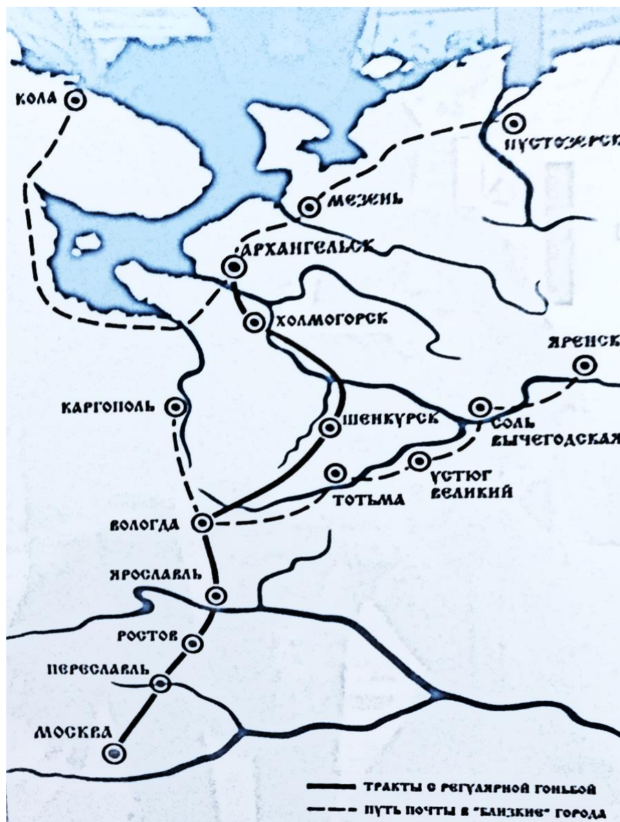
Рис. 1. Почтовые тракты русского севера. Краеведческий музей г. Архангельск.

цов и людей, ехавших по казенной надобности. Но из донесений англичан, торговавших в России, видим, что этими лошадьми могли пользоваться и купцы, как русские, так и иностранные, имея при себе вид из Приказа и платя известные прогоны [6, С. 167].