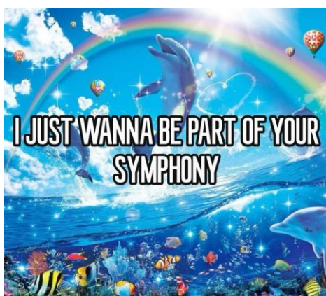
Рис. 3. Пример мема 3

Также существуют аудиовизуальные мемы метаиронии. Можно привести пример тренда метаиронического мема из оффлайн-реальности, который затем перешел в интернет-пространство. В цифровом мире возник феномен, когда