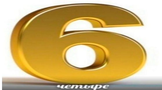
Рис. 1. Пример мема 1

Как результат лингвокреативности [2; 7] людей поколения альфа появились «обычные» мемы, воплощающие в себе черты пост-иронии и метаиронии. Тем не менее, современный юмор нельзя однозначно классифицировать только как пост-иронический или метаиронический.